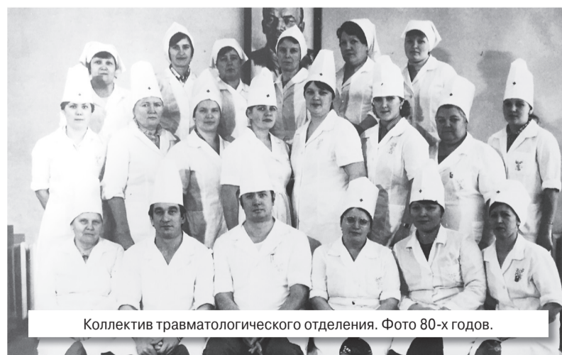
Коллектив травматологического отделения. Фото 80-х годов.